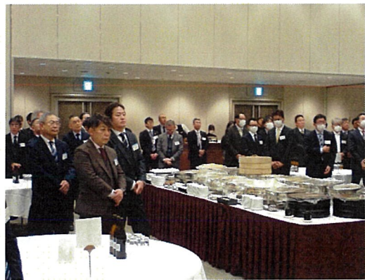
Ph-4 参加された協会員の皆様