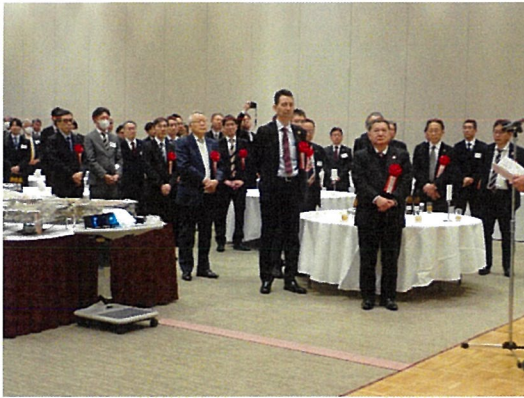
Ph-3 出席頂いた来賓の皆様