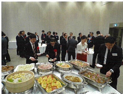
Ph-7 歓談中の会場風景