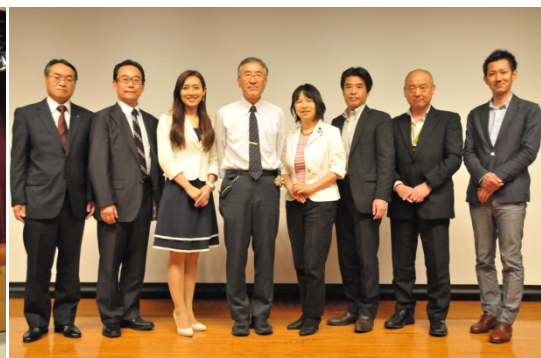
出演者と理事長および実行委員長